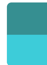
1/2 Pág. Horizontal